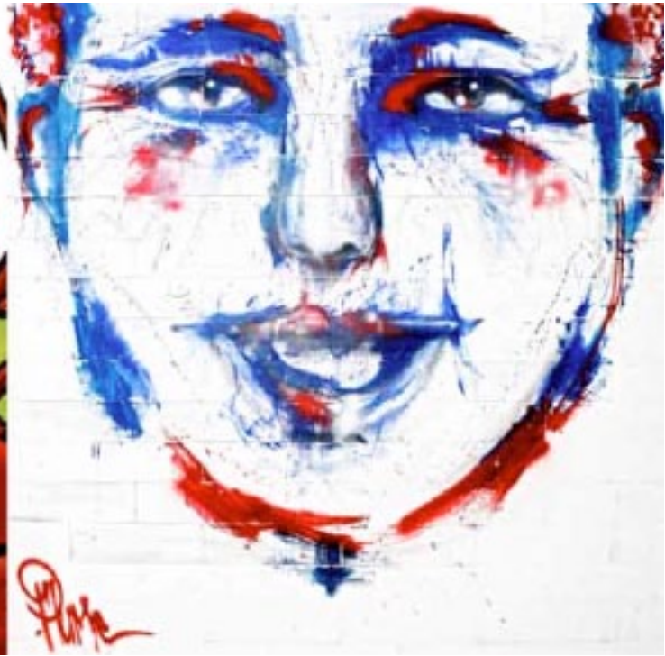
Fresko Paris - Berlin, Cirque d'Hiver Bouglione, Paris 2012